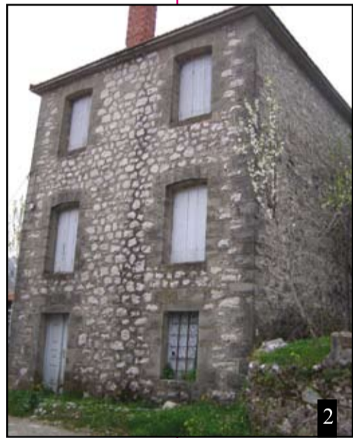
Χτύπημα θα δώσει

Το παλιό πέτρινο σπίτι στα Θεοδώρια ακολουθεί τους λαϊκούς αρχιτεκτονικούς κανόνες, που κυριαρχούν στην Ήπειρο. Λιτές και απλές γεωμετρικές γραμμές, εναρμονισμένες τόσο με το σκληρό και τραχύ περιβάλλον, αλλά και προσαρμοσμένο στις τότε βασικές ανάγκες, αλλά και στις οικονομικές και κοινωνικές συνθήκες. Χοντροί πέτρινοι τοίχοι, μιας και τα σπίτια πολλές φορές μετατρέπονταν και σε σπίτια-οχυρά. Μικρά παράθυρα με σιδεριές, χοντρές πόρτες από πελεκημένα ελατσία ξύλα. Τα υλικά από το άμεσο περιβάλλον. Τις γκρίζες πέτρες από τα ρέματα και τα χωράφια, τα αγκωνάρια από μαύρο λιθάρι από μαντέμια, τον άμμο από το ποτάμι και τον ασβέστη από ασβεσταριές κοντά στο χωριό. Το ξύλο για τις ξυλοδεσιές κέδρινα. Πολύ παλιά τα σπίτια ήταν ισόγεια. Κυρίως ένα δωμάτιο μεγάλο για όλες τις ανάγκες. Στις αρχές του προπερασμέ-