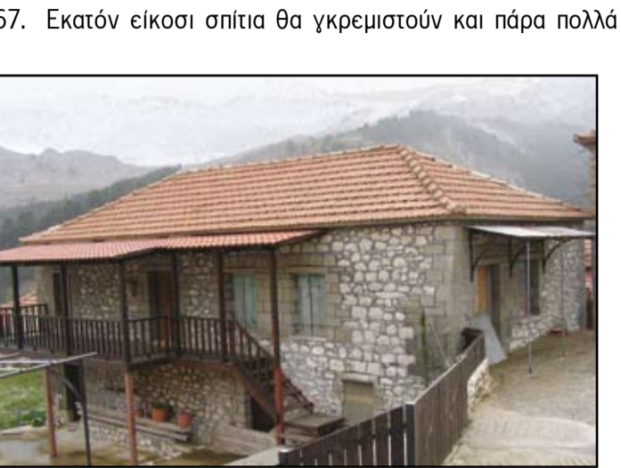
Κάποιο από τα ιστορικά μνημεία του χωριού

Μου δάσκαλος Νίκος Βότσης, τον έστειλαν εκδικητικά να υπηρετήσει σε μονοτάξιο, που λειτουργούσε το καλοκαίρι κι έλκινε με τα χιόνια τον χειμώνα. Στα Θεοδώρια, κοινοσημεία γάτο από την κορυφογραμμή της Πίνδου που χωρίζει την Ήπειρο από τη Θεσσαλία. Σε καλό, τελικά, τον βήγξε: Φυματικός άφησε τις φυλακές της Αθήνας και έγινε ταξίτζης μέσα στα έλατα και τη θάλαψη ενός χωριού ρημαγμένου και χαροκαμένου -πρώτη γραμμή πυρός στην Εθνική Αντίσταση και στον Εμφύλιο. Τα Θεοδώρια σε οπτική επαφή με τη Μεσοίοντα, όπου ο θάνατος έπλησε ύπουλο καρτέρι στον Αρη Βελουχιώτη, και σε ίση απόσταση από το Βουγαρέλι, όπου και τα στρατηγείο του Νασιόλεοντα Ζέρβα ... Δεν ζούσε για ο πατέρας, όταν, μετά τη μεταπολίτευση, οι Θεοδωριανίτες της Αθήνας σε ειδική τελετή τίμησαν «τον άξιο δάσκαλο» και φερόθησαν να πείσουν τον γιο του να επισκεφθεί τον τόπο που δίδαξε. Να 'μα, λοιπόν, σαν σε προσάννημα. Λίγους μήνες