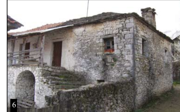
Δίπατο με κατώγι και εξωτερική πέτρινη σκάλα, με τα χαρακτηριστικά μπλέ παράθυρα δεμένα αρμονικά με την πέτρα. Το τσιμέντινο χαγιάτι είναι μετέπειτα προσθήκη, αφού το ξύλινο κατέρρευσε. Στην περίοδο του εμφυλίου επιτάχθηκε και χρησιμοποιήθηκε κι αυτό σαν κρατητήριο.

Η κούλια του Χωριού (Καλιαμήτρου) (φωτό 5). Το αρχιτεκτονικό και ιστορικό κώσημα του χωριού μας στέκεται ακόμα όρθιο. Χτισμένο γύρω στα 1800, διατηρείται όπως ακριβώς ήταν. Στην περίοδο της Τουρκοκρατίας φιλοξενούσε τους Τούρκους αγάδες και φοροεισπράκτορες, όταν επισκέπτονταν τα Θεοδώρια. Δίπατο