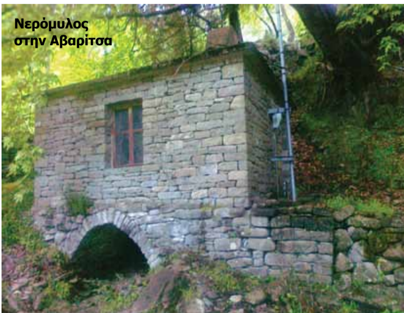
Νερόμυλος στην Αβαρίτσα