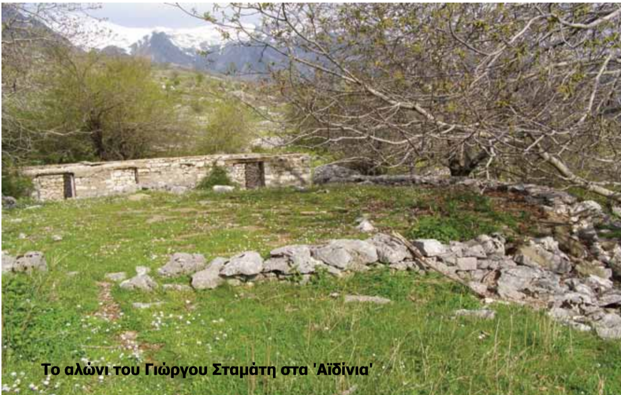
Το αλώνι του Γιώργου Σταμάτη στα 'Αϊδίνια'

ζουν. Οι αλωνιστές τα σταματούσαν πότε πότε για να γυρίσουν με