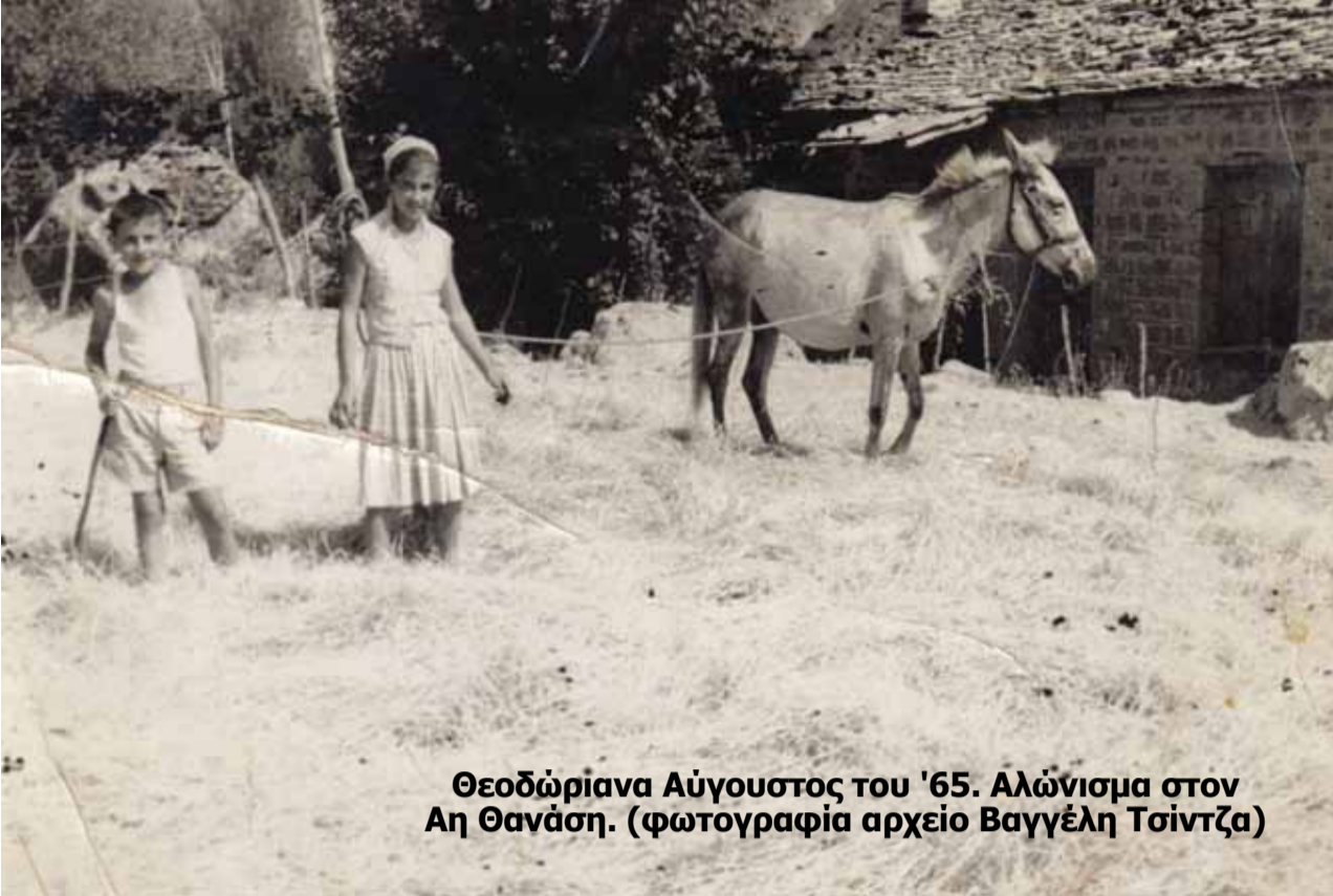
Θεοδώριανα Αύγουστος του '65. Αλώνισμα στον Αη Θανάση.

ζουν. Οι αλωνιστές τα σταματούσαν πότε πότε για να γυρίσουν με