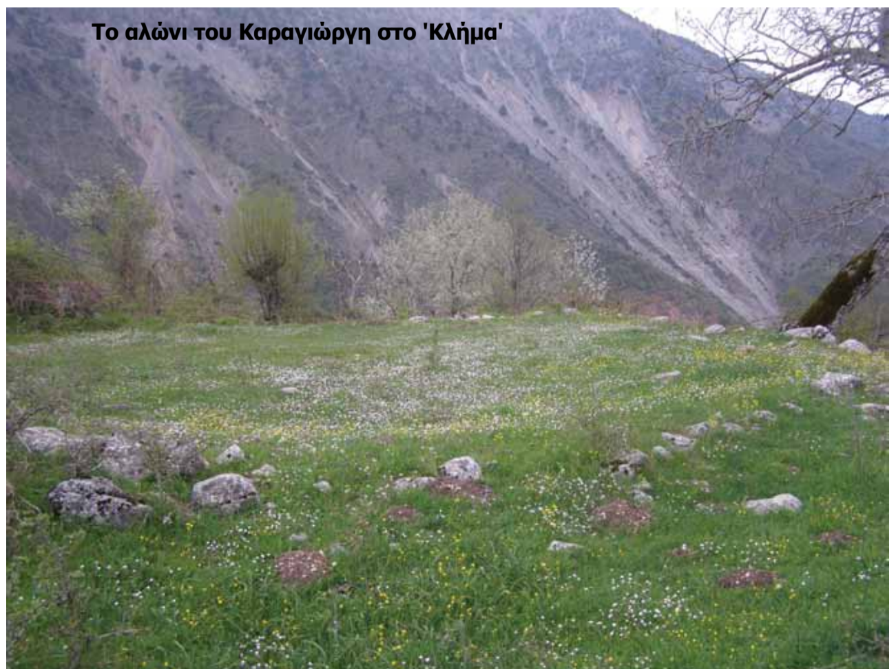
Το αλώνι του Καραγιώργη στο 'Κλήμα'

Η μέχρι τώρα εμπειρία στην ανάπτυξη τέτοιων έργων στην Ελλάδα είναι στο νησί Αί-Στράτης, το οποίο είναι το πρώτο "Πράσινο Νησί" στην Ελλάδα.